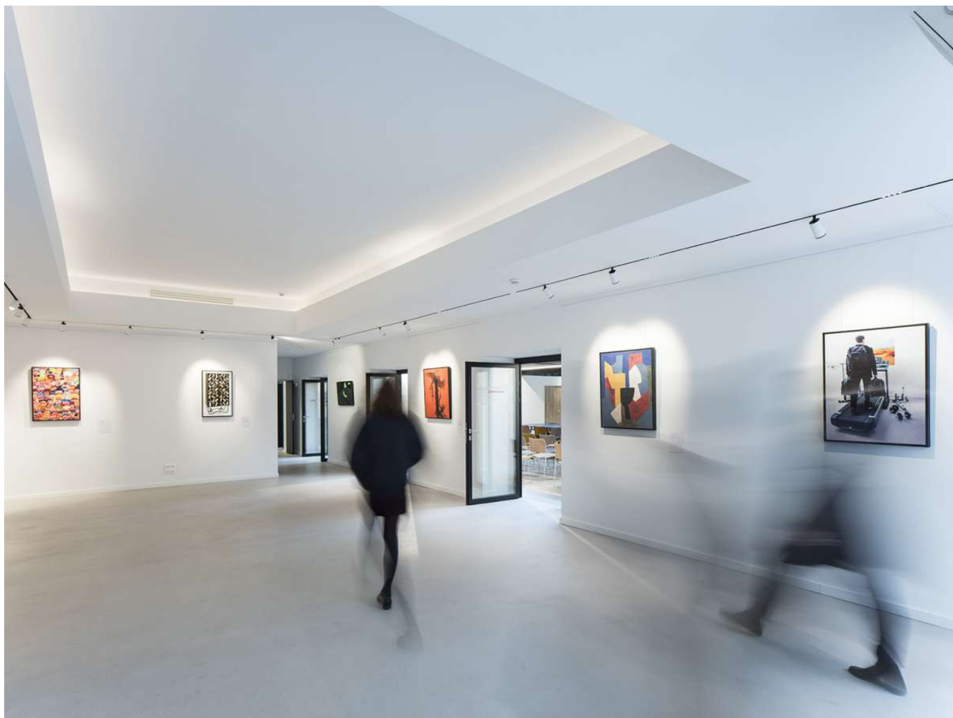
Hall de l'ADAGP